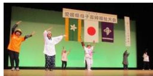
愛媛県大会での私たち