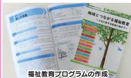
福祉教育プログラムの作成