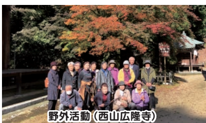
野外活動 (西山広隆寺)