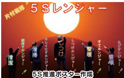
5S推進ポスター作成