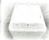
避難所・作業用備品 洗濯機