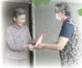
小学生のお手紙と ともにおたより訪問