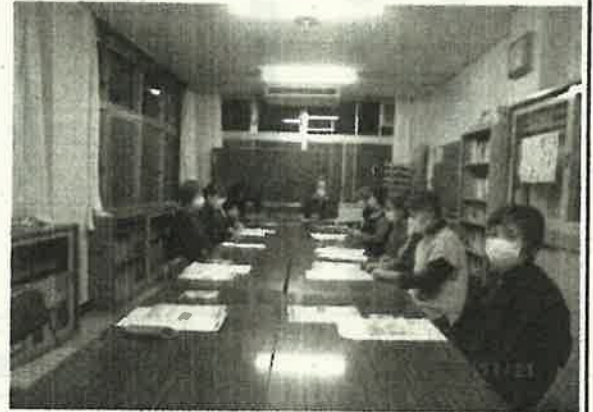
校区見守り推進員定例会

見守り推進員は、七十歳以上の一人暮らしの高齢者が安心して生活できるように、民生委員さんや、ご近所の方と協力しながら安否確認をしたり、生活相談に応じたり、関係機関と連携を取るなどして独居高齢者の方々を見守りや声掛けをしています。惣開校区には、次の八名の見守り推進員が、各地区を担当して活動をしています。地域の皆様のご協力よろしく申し上げます。